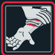
5. zīmējums Brūces aizspiešana spēcīgas asiņošanas gadījumā