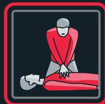
3. zīmējums Sirds masāža