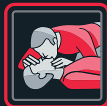
4. zīmējums Cietušā elpināšana