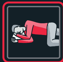
2. zīmējums Stabilā sānu poza